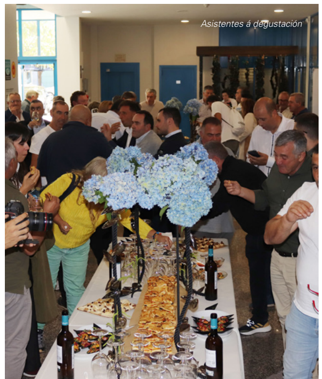
Asistentes á degustación

Desde a súa orixe humilde expandiuse polo mundo, triunfando alí onde chegou. Un produto que nos fai sentir orgullosos de ser galegos”.