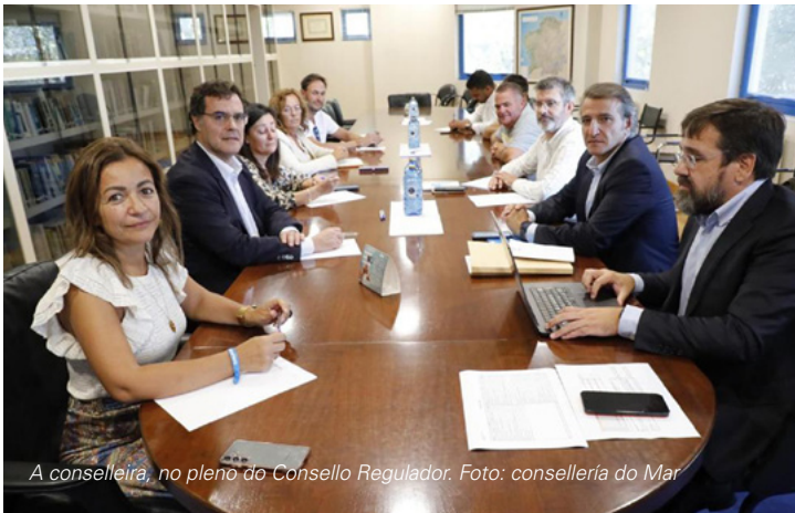
A conselleira, no pleno do Consello Regulador.