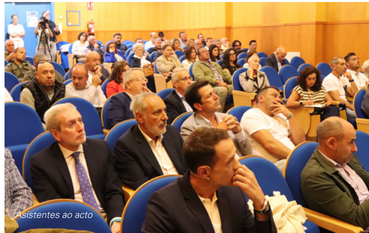
Asistentes ao acto